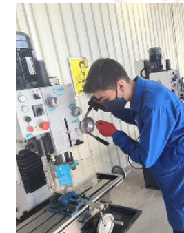
Temel Mekanik Atölyesi