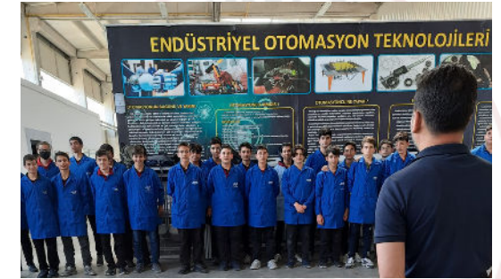
Temel Endüstri Uygulamaları Atölyesi