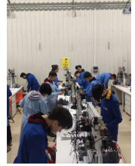
Ardışık Kontrol Atölyesi